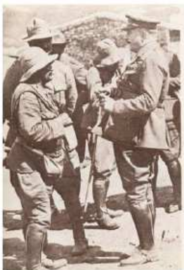
Primo de Rivera visita las tropas españolas en Marruecos.