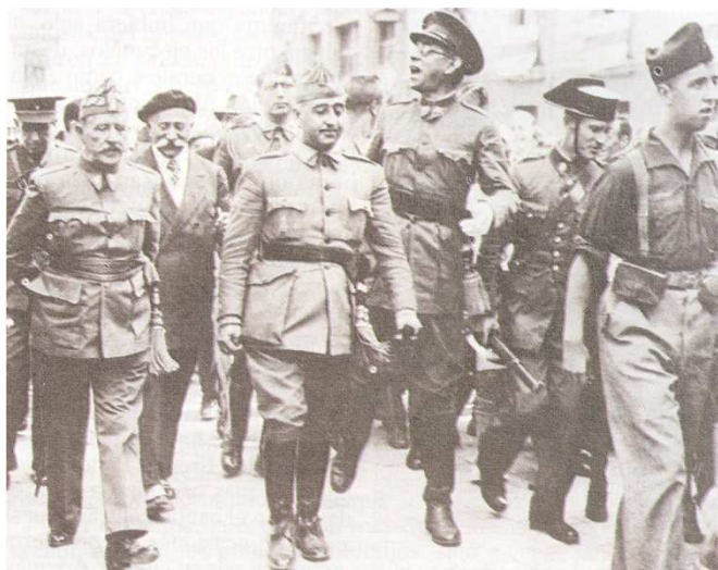
Los generales Franco, Mola y Cavalcanti en Burgos