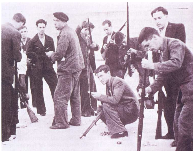
Entrega de fusiles a la población de Madrid por el gobierno de la República, 18 de julio de 1936