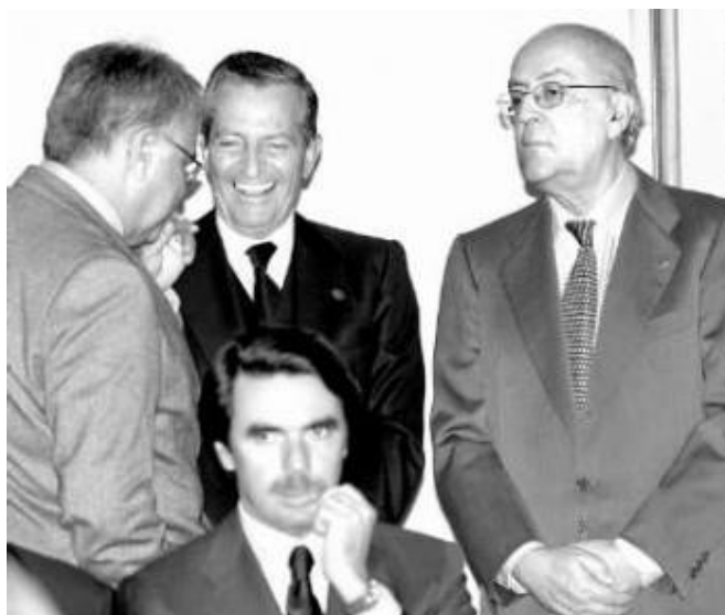
Presidentes del gobierno en la Monarquía de D. Juan Carlos I