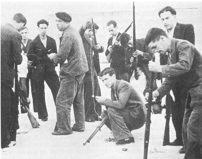
Entrega de fusiles a la población de Madrid por el gobierno de la República, 18 de julio de 1936