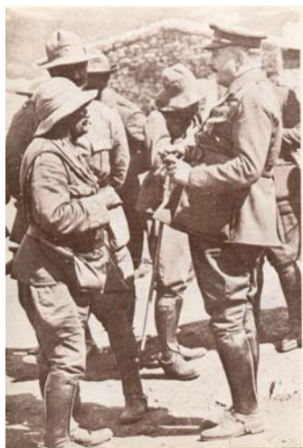
Primo de Rivera visita las tropas españolas en Marruecos.