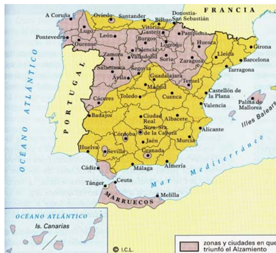
División de España tras el alzamiento militar de julio de 1936.