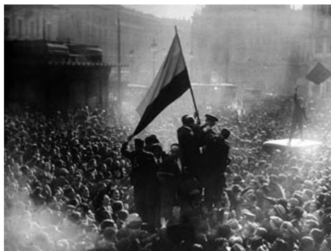
Proclamación de la II República